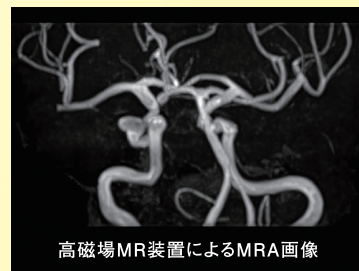
高磁場MR装置によるMRA画像

当クリニックでは1.5テスラの 高磁場MR機器 を導入しており、 高精度のMRA画像診断 が可能です。