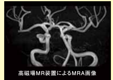
高磁場MR装置によるMRA画像

当クリニックでは1.5テスラの 高磁場MR機器 を導入しており、 高精度のMRA画像診断 が可能です。