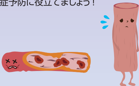
日本における心不全発症の予測

心不全の患者は急増中で、今ではがんよりも多い120万人以上が罹患しています。特効薬がなく、5年生存率はがんよりも低いとされている心不全を早期に発見し、発症予防に役立てましょう！